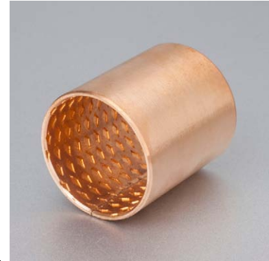
内外倒角 ID and OD chamfers